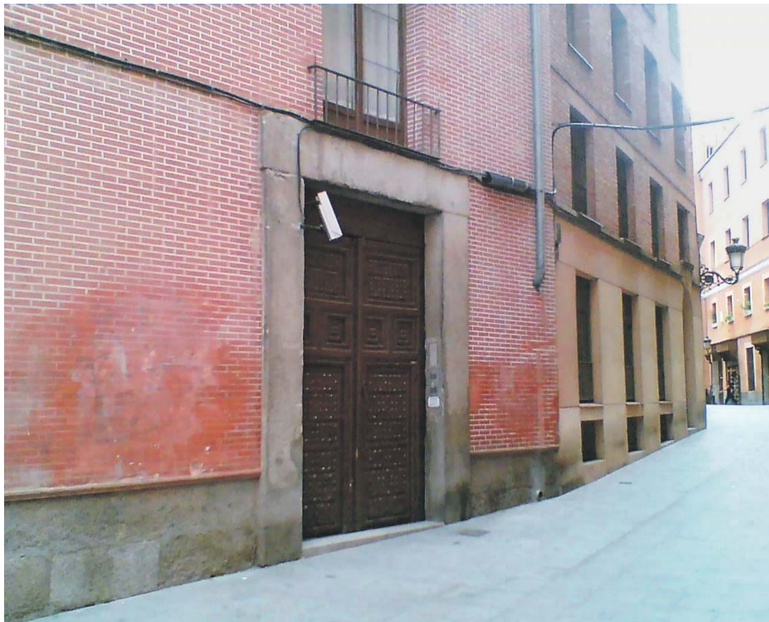
Ohne Marienbekenntnis kein Einlass: Wer an dieser Türe den richtigen Spruch lösst, darf eintreten in das Reich der backenden Nonnen.

Neben dem Fensterrahmen hängt eine Liste mit dem Angebot: